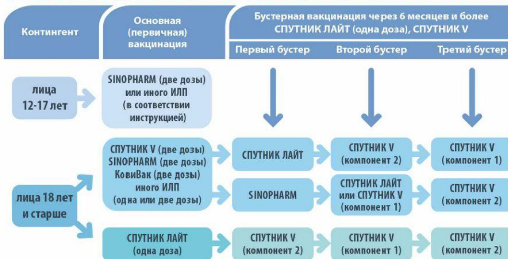
СХЕМА ПРОВЕДЕНИЯ БУСТЕРНОЙ ВАКЦИНАЦИИ ПРОТИВ COVID-19

ПО ДАННЫМ ВСЕМИРНОЙ ОРГАНИЗАЦИИ ЗДРАВООХРАНЕНИЯ ЗА ПОСЛЕДНИЕ 150 ЛЕТ ПРОДОЛЖИТЕЛЬНОСТЬ ЖИЗНИ УВЕЛИЧИЛАСЬ НА 30 ЛЕТ, ИЗ НИХ НА 25 ЛЕТ БЛАГОДАря ВАКЦИНАЦИИ!